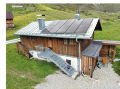
Hüttenwart Rainer Müller

Es bleibt auf alle Fälle Zeit für die ein oder andere Tour in der Umgebung. Eine gute Möglichkeit unsere SW-Hütte kennenzulernen!