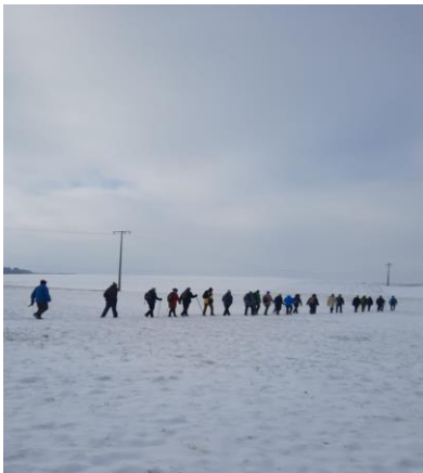
Winterwanderung bei Sulzfeld