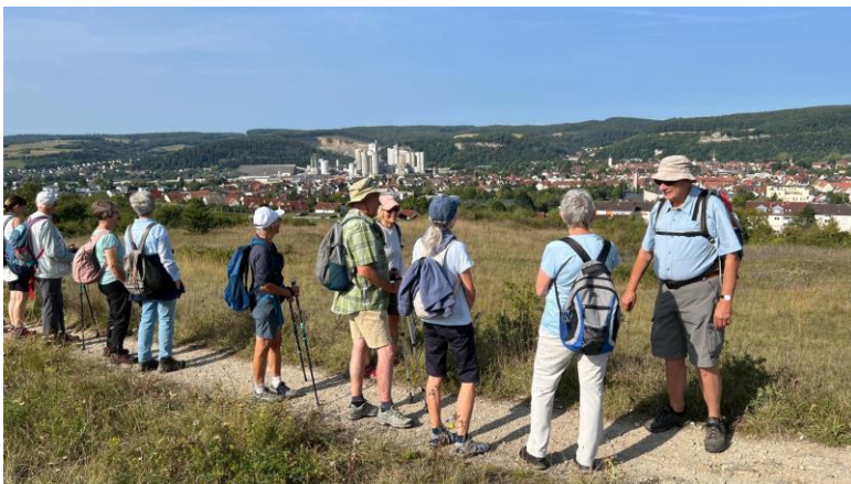
Zum Edelweiss bei Karlstadt