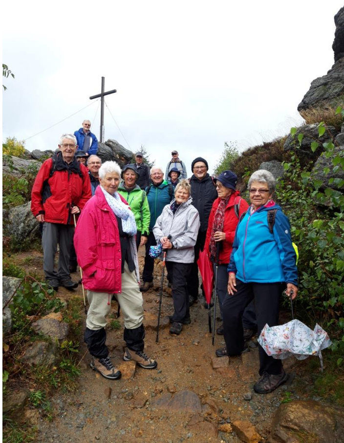
Zum Aufwärmen bei regnerischem Wetter schafften wir 9,5 km.