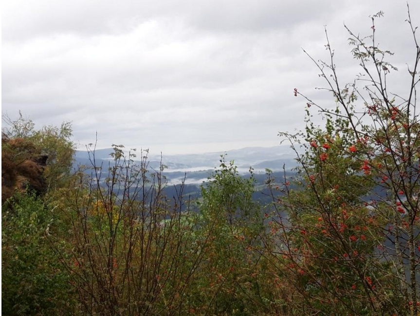
Blick vom Silberberg

Treffpunkt 10:30 nach dem Frühstück. Wanderung zum Silberberg, vorbei an der Silberbergmine und auf dem Wanderweg 10 zurück zum Hotel.